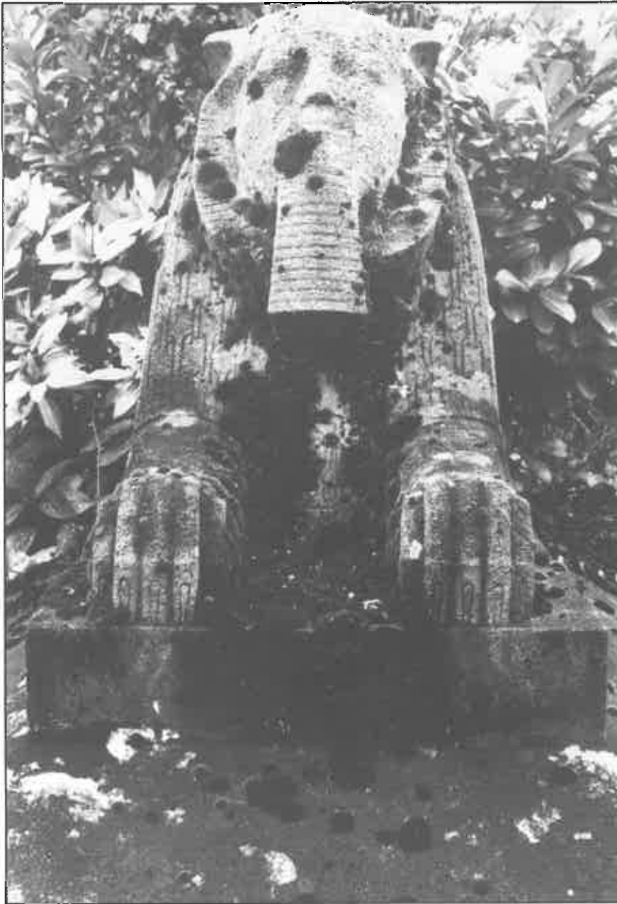
Detail van het grafmonument op blz. 1.

verwijderen van mossen en korstmossen niet erger is voor het substraat dan de begroeiing.