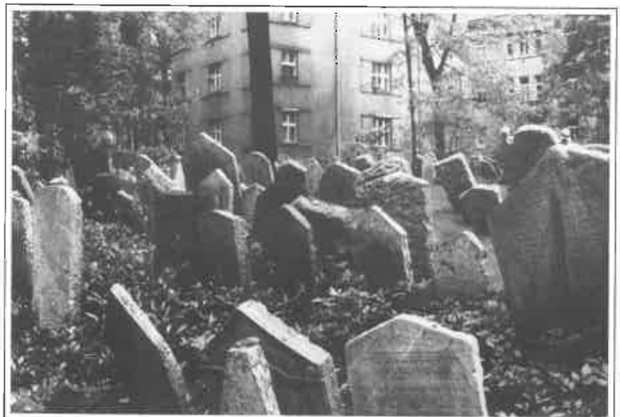
Algemeen zicht op het oude Joodse kerkhof.

Die versiering is meestal familiegebonden en heel vaak pictografisch. Zo zijn alle graven van de