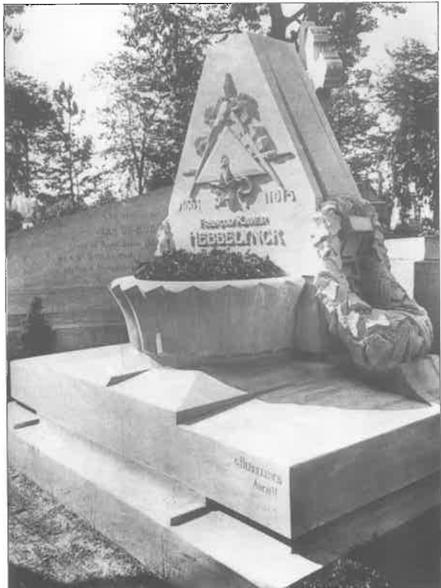
Begraafplaats Schaarbeek. Graf van architect F.X. Hebbelynck naar een ontwerp van Guillaume Hebbelynck (uit : L'Emulation, jg. 46, 1926, pl. 23, verz. Sint-Lukasarchief, Brussel).

Misschien was het u reeds opgevallen in onze vorige nieuwsbrief: het lidgeld wordt opgevoerd tot 550 BEF . Uw steun is van levensbelang voor de vereniging.