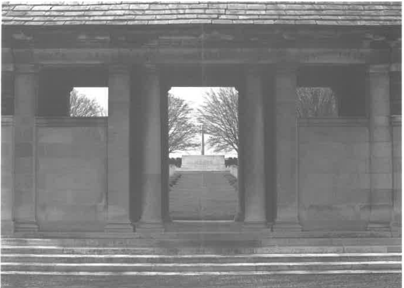
Zonnebeke. Polygon Wood Cemetery naast het Polygoonbos. Het in de oorlog helemaal verwoeste bos werd daarna volledig heraan geplant . Langemark. Deutscher Soldatenfriedhof met 29.709 graven. Beeldengroep door Emil Krieger (München).