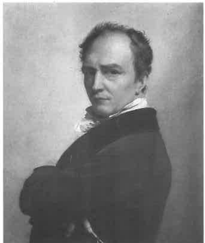
F.-J. Navez, schoonvader van Portaels. Zelfportret, 1826.

Ook in de Brusselse Academie speelde Portaels een steeds grotere rol, vanaf 1863 werd hij leraar in de teken- en schilderkunst maar hij nam al in 1865 ontslag. Na Navez overlijden, in 1869, erfde Portaels al de bezittingen van zijn schoonvader. Het "atelier libre" hield nog stand tot in 1870 toen Portaels voor vier jaar naar Marokko vertrok. Het huis en atelier van Navez-Portaels werd afgebroken voor de sanering van de O.-L.-Vrouw ter Sneeuwwijk. Een stukje artistiek Brussel verdween voor goed van de kaart. Na zijn terugkeer uit Afrika werd Portaels vanaf 1878 directeur van de Brusselse Academie en dit tot aan zijn dood in 1895.