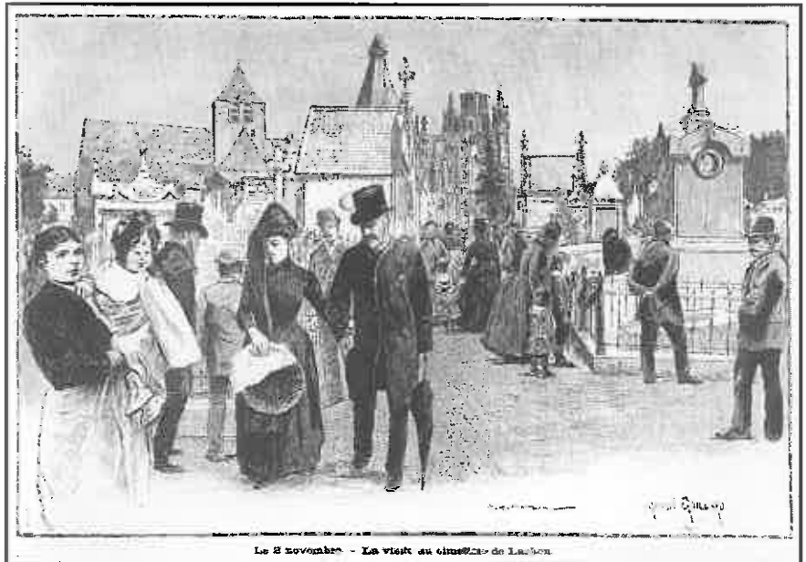
Bezoek aan het kerkhof van Laken, Allerzielen 1902. Uit "Le Patriote illustré".