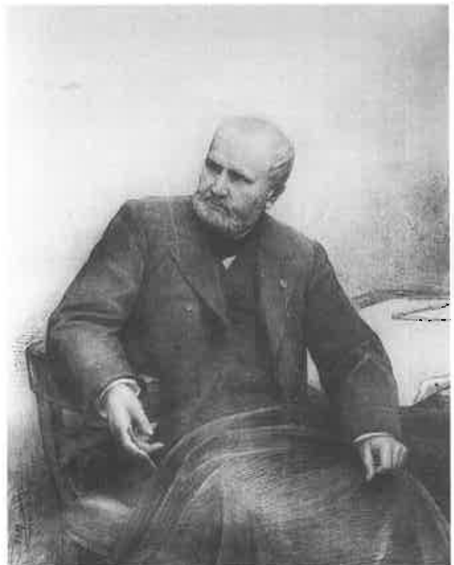
Alphonse Balat (Gochenée, 1818 - Elsene, 1895), uit " L'Emulation ", 1909, pl. 1.

In een nota gepubliceerd in het " Annuaire de l'Académie royale des Sciences, Lettres et Beaux-Arts de Belgique " uit 1903 leert tijdgenoot architect Gédéon Bordiau ons Balat meer als persoonlijkheid kennen. In zijn kunst zowel als in persoon streefde Balat naar de nobelheid van de eenvoud. Zijn formule "vereenvoudig" was niet ingewikkeld schreef Bordiau: " Vereenvoudig, vereenvoudig nogmaals en als u alles hebt vereenvoudigd, dan heb je nog niet voldoende vereenvoudigd! ". Geheel zijn architectuur berust op die formule en op het principe van "het Schone om zich". Balat creëerde een boeiende, energieke en krachtige architectuur, hoewel in zijn eigen lichaam jarenlang geen kracht meer aanwezig was, waartegen hij, opgegeven door de geneeskunde, voortdurend bleef vechten.