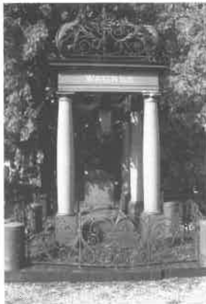
Wenen-Hietzing - Grafmonument Otto Wagner.

Aan de overzijde, perk 14A, ligt naast politici, schilders en artsen, Theophil Hansen, architect van het Parlement, de Akademie en de Beurs begraven. Wat verder liggen de Oostenrijkse presidenten, vóór de Karl Luegerkerk, gebouwd in 1910 en één der belangrijkste bouwwerken van de Jugendstil. Links van de presidenten een recenter ereperk met de politici Johann Böhm en Bruno Kreisky, de komponisten Arnold Schönberg en Robert Stolz en de acteurs Curd Jürgens en Theo Lingen. In perk 40 liggen nog een aantal beroemdheden, maar tegen de muur, tussen de ingangspoorten 2 en 3, vindt men nog enkele merkwaardige grafmonumenten. Men ontdekt er het graf van muziekpedagoog Karl Czerny, van Mozart's tijdgenoot Antonio Salieri en van Adolf Loos, voorvechter van de nieuwe zakelijkheid in de