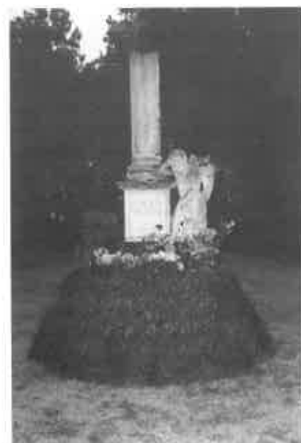
Wenen - Zentralfriedhof - Grafmonument W.A. Mozart.

Nummer vijf is Sankt Marx , het enige overgebleven Biedermeierkerkhof ter wereld. Een bezoek overwaard. Blikvanger is hier natuurlijk Wolfgang Amadeus Mozart (1756-1791). De exacte begraafplaats van de komponist kon slechts bij benadering vastgesteld worden en, in 1859, kreeg de plaats een grafmonument. Naar aanleiding