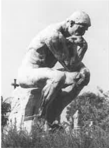
De denker van Rodin op het grafmonument van Dillen.