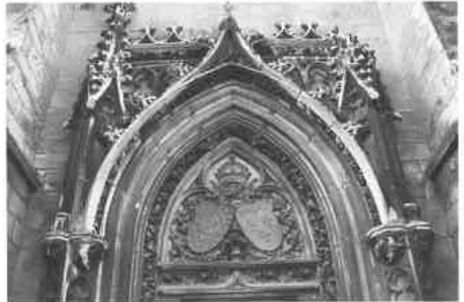
Grafmonument van de familie Khnopff