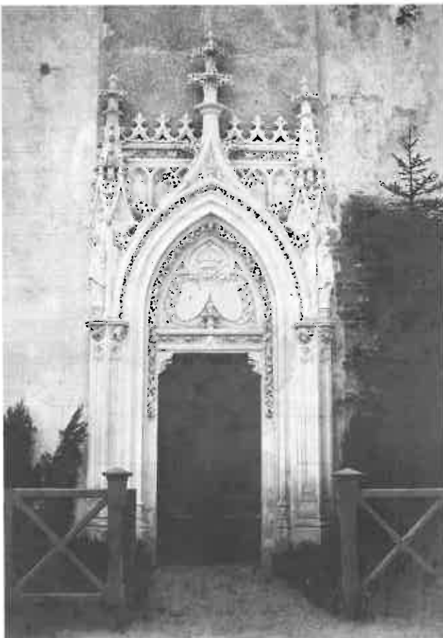
Het neogotische portaal van G. Houtstont voor de Sint-Barbarakapel, rond 1895 verplaatst naar het koor van de oude Onze-Lieve-Vrouwkerk. Foto van Jules Géruzet, met eigenhandige opdracht van ontwerper Louis De Curte aan zijn "vriend en collega J. Van Ysendyck" (verzameling Epitaaf). Rechts de huidige toestand van het timpaan (foto Linda Van Santvoort)

Toch was de bijdrage van een Franse beeldhouwer aan onze nationale monumenten soms ook