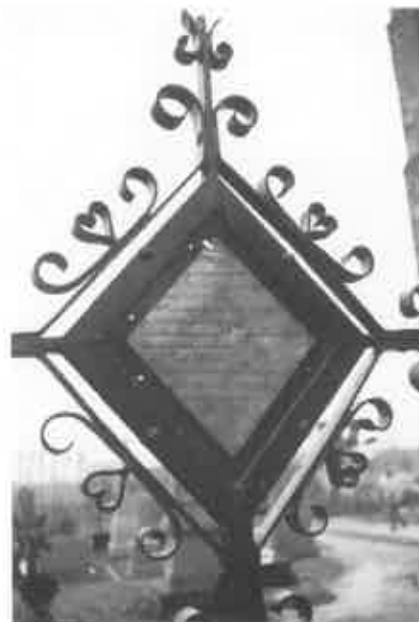
Hoeke (W.-VI.).