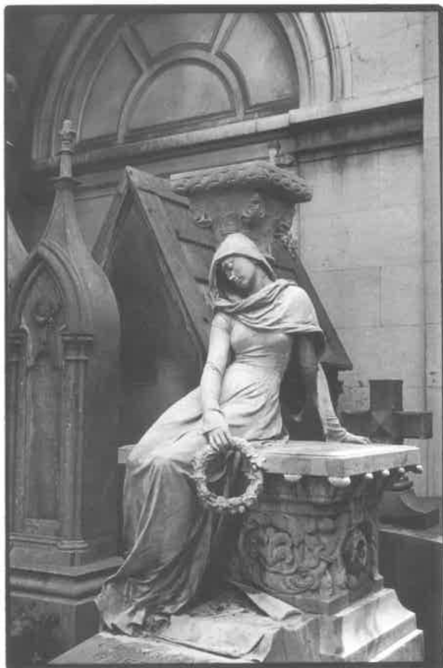
Treurende vrouw, monument op het Parijse Père Lachaise.