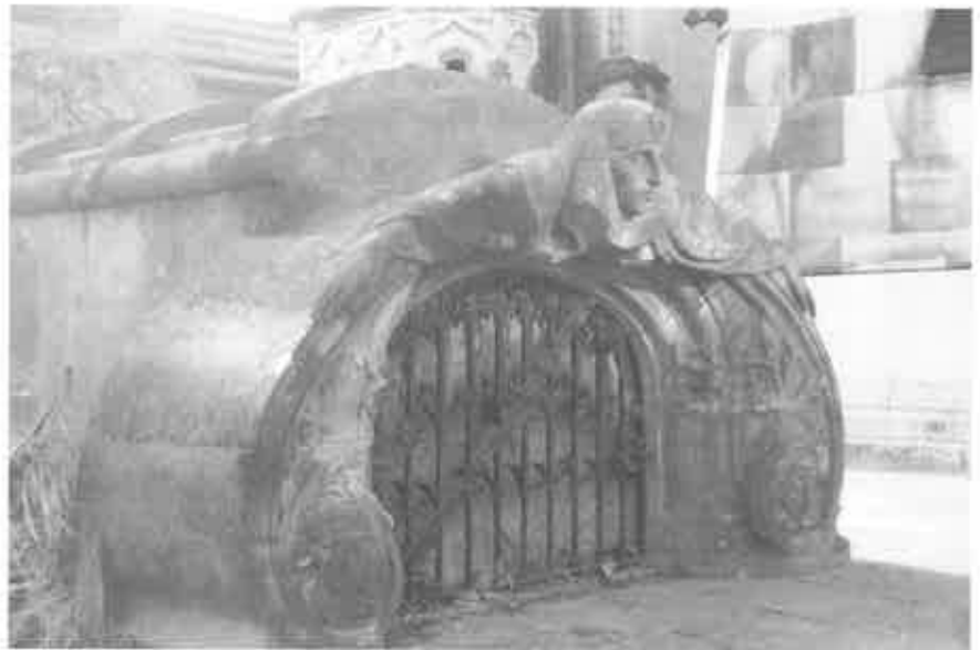
Art nouveau grafmonument op Sant Andreu, familie Vintro.

Ondergetekende hoopt enkel dat de bezoeker meer geluk heeft dan hij. De persoon die mij rondleidde deed dit dik tegen zijn zin. Het bezoek moest op een drafje gebeuren want