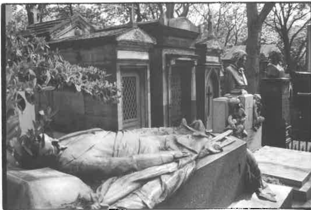
Gisant, Père Lachaise, Parijs. Alle internetfoto's ten spijt, doen de huisfotografen van Epitaaf het nog altijd beter.