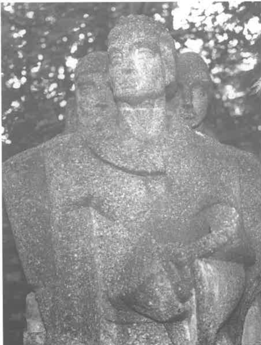
Merksem. Grafmonument Jos. De Swerts. Centraal staat de kunstenaar. De figuren links en rechts van hem verbeelden resp. de strijdbaarheid en de sierlijkheid.

Later was hij als vaste tekenaar verbonden aan de Uitgeverij (van de Abdij van) Averbode, waar hij bijdragen leverde voor de Vlaamsche Filmkens, Zonneland en de Zonnekalender. Tevens bezorgde hij de Broeders Maristen tekeningen voor hun lees- en leerboekjes en was hij illustrator van boeken van verschil-