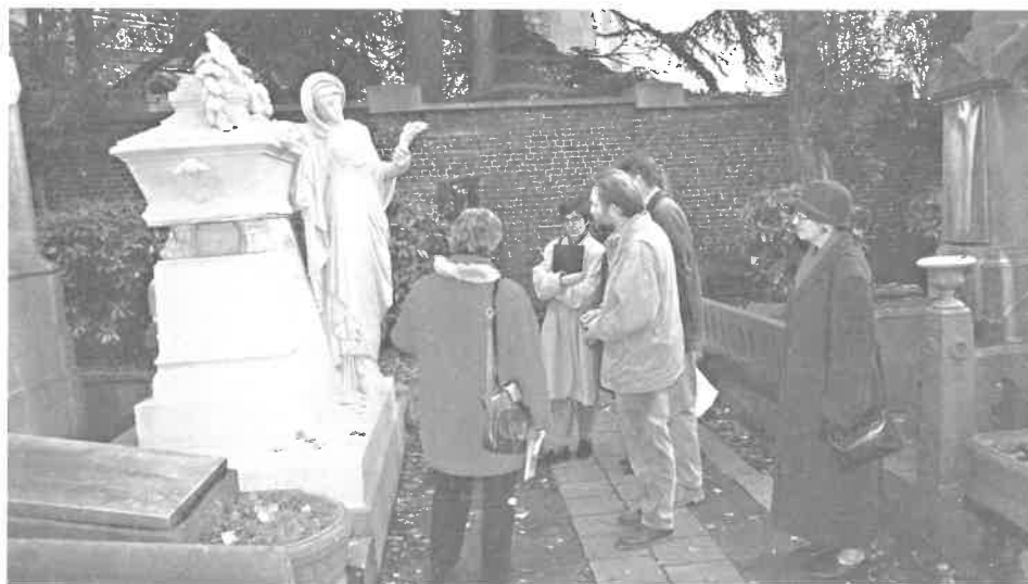
Bezoek aan het gerestaureerde monument Pleyel op het kerkhof van Laken (1996)

Het grafmonument Biart-Van de Velde uit 1907 naar ontwerp van Henry Van de Velde – oorspronkelijk opgericht aan de stedelijke begraafplaats Kiel waar het na sluiting in 1936 werd overgebracht naar de ateliers van Pateet- vindt na jaren dan toch zijn laatste 'rust'plaats in de funeraire tuin van de voormalige ateliers Salu. Op 23 maart wordt VCM (Vlaamse Contactcommissie Monumentenzorg) boven de doopvont gehouden, Epitaaf is stichtend en effectief lid. Epitaaf is mede organisator