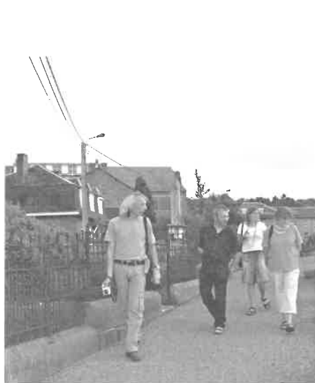
Prospectie op begraafplaatsen in Wallonië (2008)