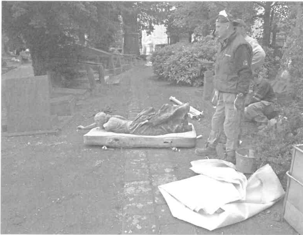
Na diefstal op de begraafplaats van Laken blijft het bronzen beeld Vers l'avenir zwaar beschadigd achter. Epitaaf doet het nodige om wat er nog van rest in veiligheid te brengen (2009)