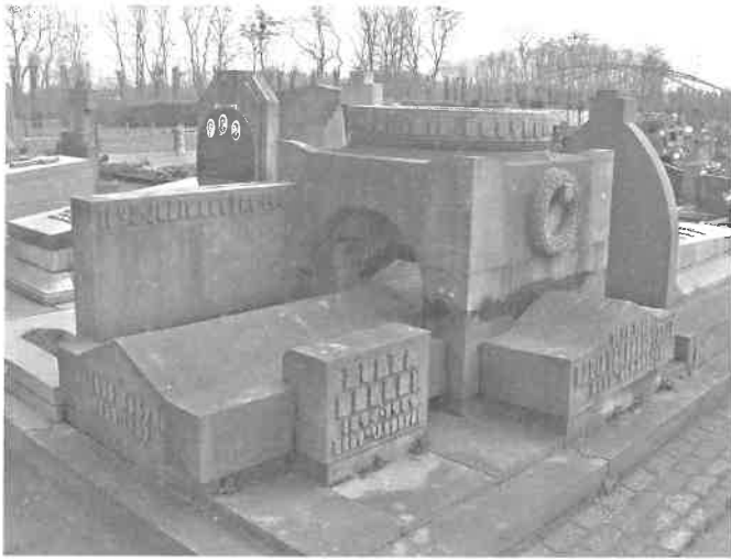
Melle, familiegraf Cosyns, 1945

Een belangrijk en vroeg initiatief tot meer systematische inventarisatie van begraafplaatsen tot op het niveau van het individuele grafteken werd genomen door de stad Gent waar een werkgroep werd opgericht met het oog op het selecteren van de belangrijkste graven op de Gentse begraafplaatsen. Het resultaat van deze inventarisatiecampagne werd al in 1981 gepubliceerd 1 . De strenge selectie vormde alvast een eerste aanzet tot behoud en ontsluiten van de historisch meest waardevolle grafmonumenten op Gentse begraafplaatsen.