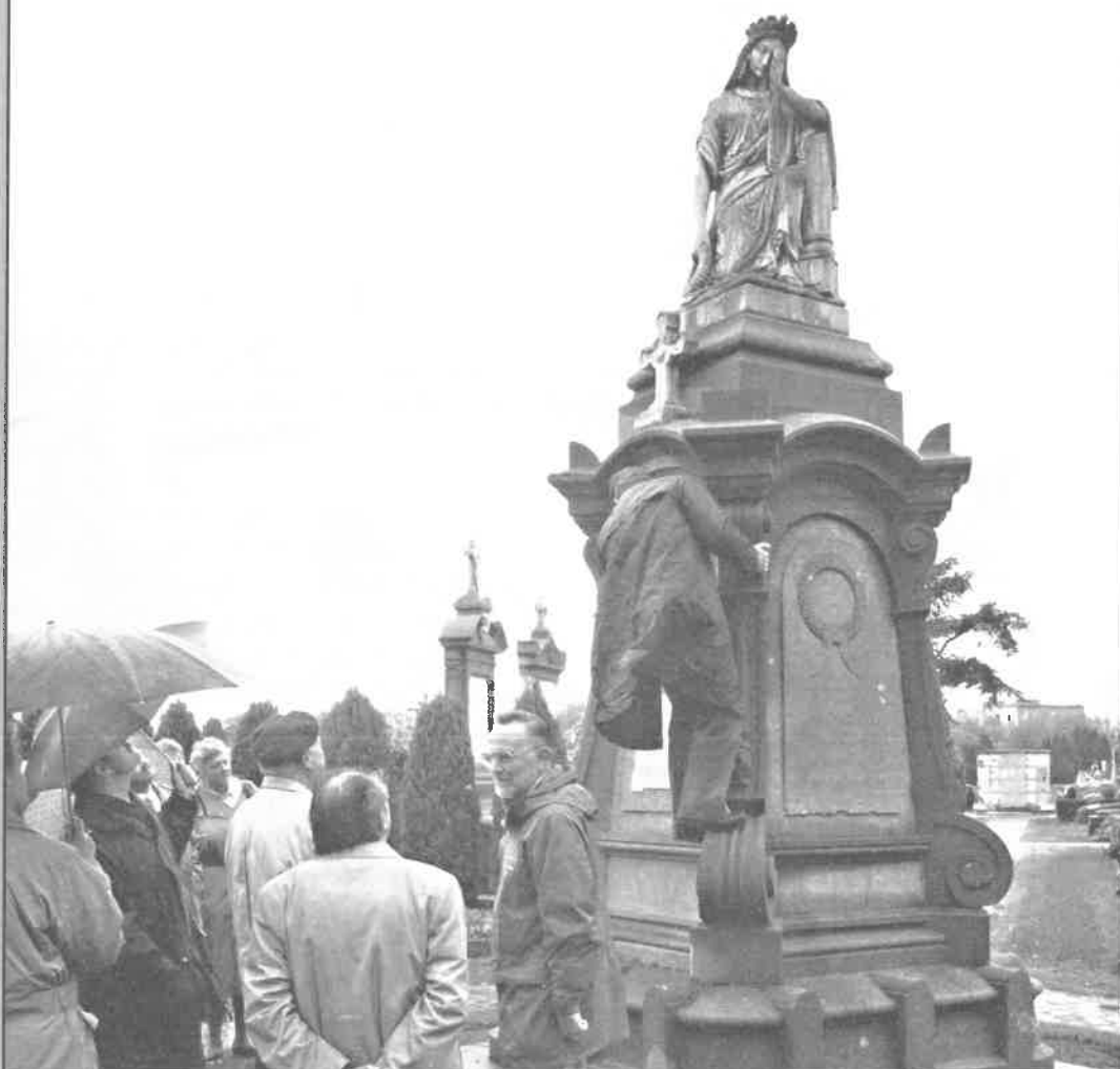
Epitaaf start haar activiteiten met begraafplaatsbezoeken vanaf 1987. Het praalgraf van Frans Van Hombeeck op de begraafplaats van Berchem