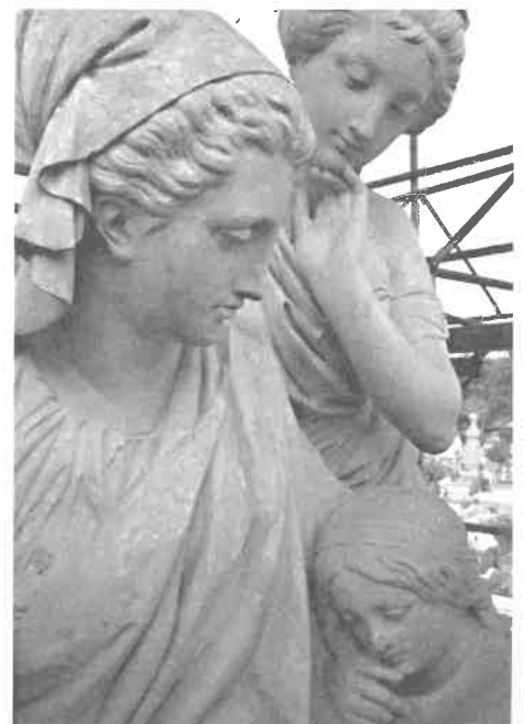
Het monument Ghémar op het kerkhof van Laken tijdens de restauratie (1990)

Koning Boudewijn stichting een toelage voor het uitvoeren van de meest dringende werkzaamheden aan de ateliers Salu. Hiermee wordt de start gegeven aan een lange en nog steeds lopende restauratiecampagne. In Brussel heeft de allereerste Open monumentendag plaats. Epitaaf neemt deel met een open-deur-dag E. Salucentrum op 10 september. Voor het eerst worden de voormalige ateliers Salu toegankelijk voor het grote publiek dat enthousiast reageert. Deelname aan de Open Monumentendagen wordt van dan af een bijna vast onderdeel in de programmatie van Epitaaf.