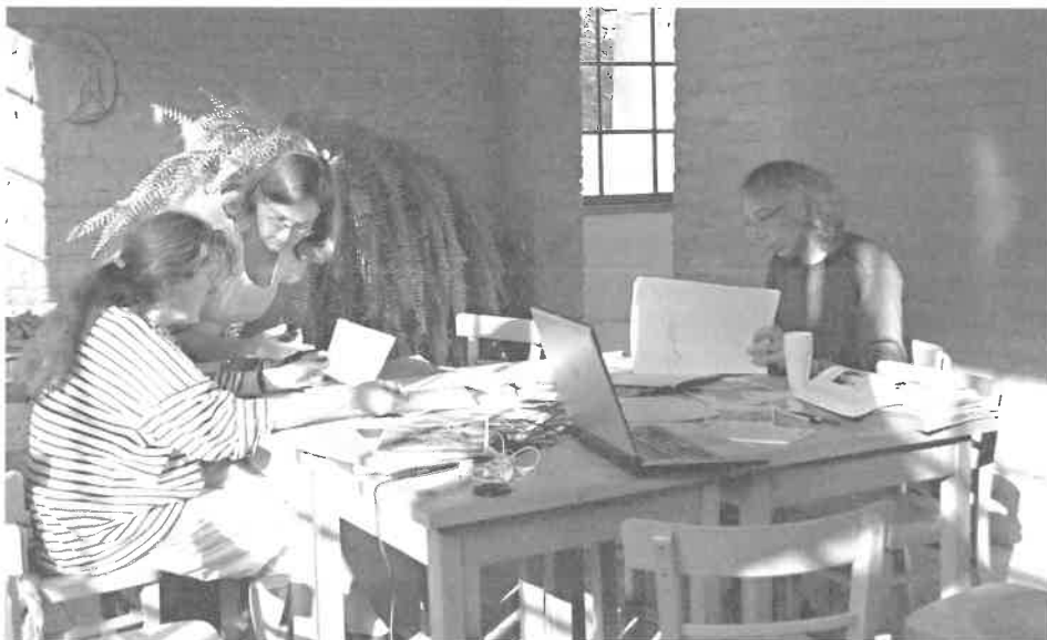
Vorbereitung van de studie van de begraafplaats van Elsene (2008)