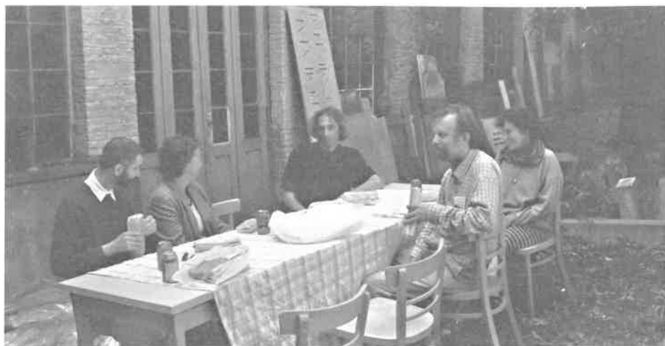
Open Monumentendagen van 18-19 september 1999. Picknick van de vrijwilligers in de funeraire tuin (1999)

Onder de titel De verbeelding in context worden avondwandelingen op het kerkhof van Laken gevolgd door de vertoning van 'religieuze' films uit de jaren 1910 met orgel-begeleiding. Het initiatief van het Filmmuseum en het Koninklijk Filmarchief van België krijgt de steun van de Koning Boudewijnstichting en wordt begeleid door een gelijknamige publicatie. Het grafmonument Wyns de Raucourt op de begraafplaats