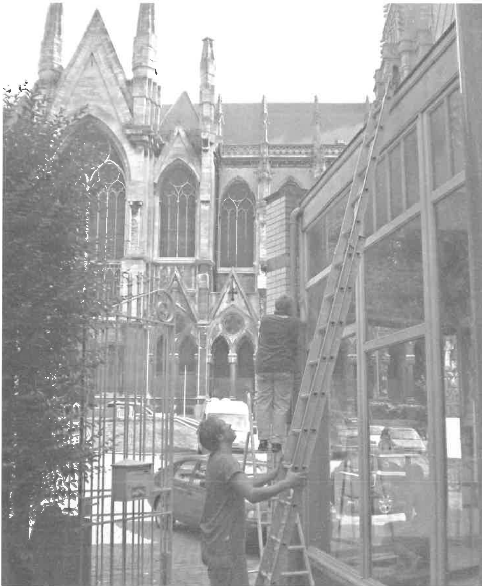
Het centrum voor funeraire archeologie vraagt ook permanent onderhoud (2009)