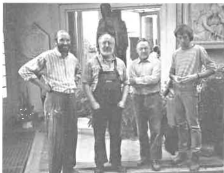
De voorbereidende werken worden grotendeels in eigen beheer en door vrijwilligers uitgevoerd (1991)