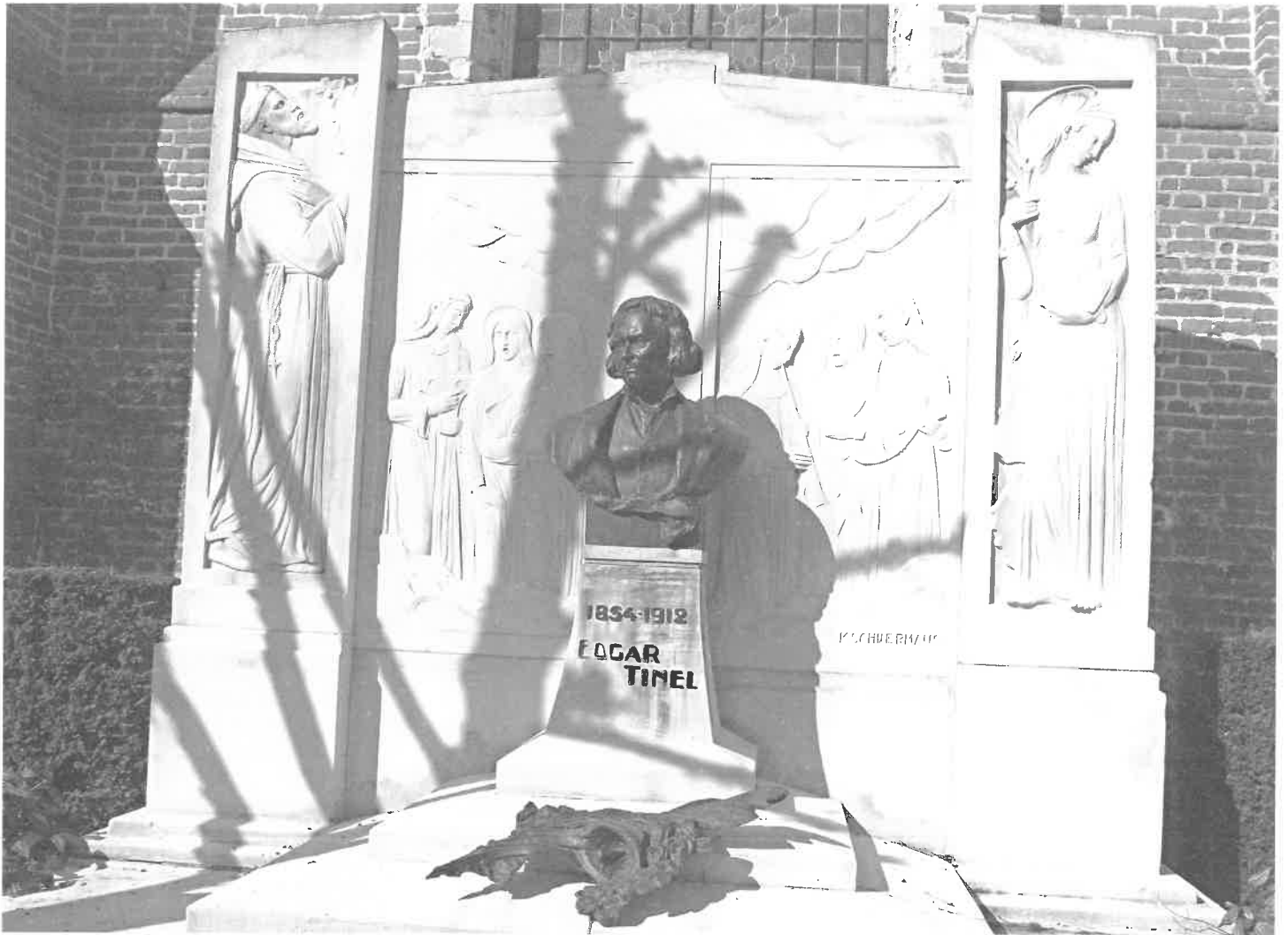
Sinaai, kerkhof aan de Catharinakerk, grafmonument Edgar Tinel

in het behoud van Vlaamse en Brusselse begraafplaatsen en graftekens. Intussen zijn reeds heel wat begraafplaatsen en ook individuele grafmonumenten in Brussel en Vlaanderen beschermd. Een exhaustieve lijst geven van al deze beschermingen zou ons te ver brengen. 28 Voor de aanpak van de beschermingen op niveau van het Vlaams Gewest binnen de Vakafdeling funerair erfgoed verwijzen we naar de bijdrage van M. Celis in het tijdschrift Monumenten en Landschappen . 29 In Vlaanderen is een intensieve thematische beschermingscampagne van militaire begraafplaatsen die verband houdt met de Eerste en