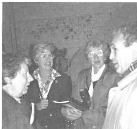
Voorstelling van de publicatie Omtrent het Onze-Lieve-Vrouwvoorplein. De dochters Salu zijn aanwezig en nemen een publicatie in ontvangst (1995)

Epitaaf doet voor een tweede keer de oversteek naar Londen en bezoekt er van 8 tot 10 mei de belangrijkste begraafplaatsen.