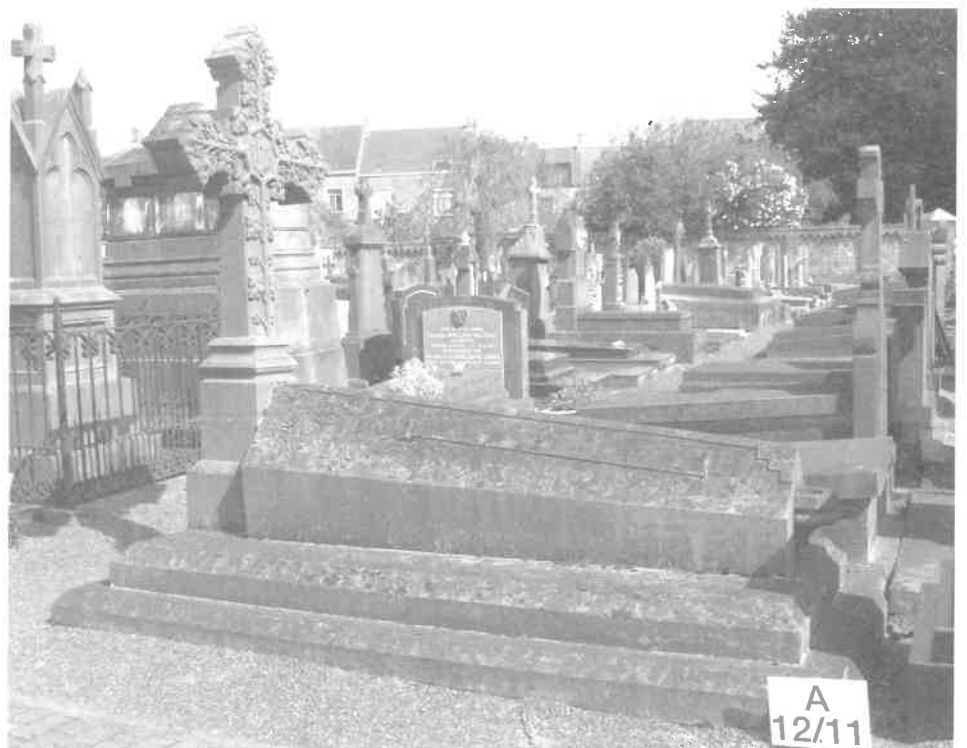
Veurne, stedelijke begraafplaats, grafmonument Ferdinand Valcke

Het in Vlaanderen uitgevaardigde nieuwe decreet op de begraafplaatsen en de lijkbezorging van 16 januari 2004 was zeker een belangrijke impuls tot meer algemene inventarisatie van begraafplaatsen en graftekens ook op lokaal (gemeentelijk) niveau. De stads- en gemeentebesturen worden immers aangespoord een lijst op te maken met graven van lokaal historisch belang . Naar aanleiding van dit decreet werd door Epitaaf vzw in samenwerking met het Contactforum voor Erfgoedverenigingen (VCM) een inventarisatiefiche op punt gesteld die het resultaat is van jarenlange ervaring. In samenwerking met de Universiteit Gent – departement Kunstwetenschappen - loopt sinds 2004 een proefproject waarbij de inventarisatiefiche wordt getoetst op haar bruikbaarheid en op basis