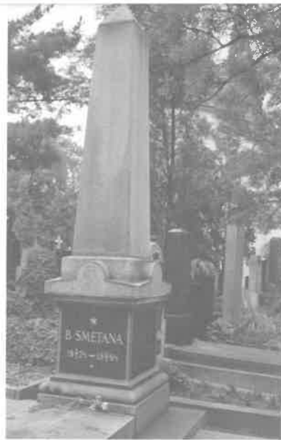
Praag, Vysehrad, Svatopluk Cech -- Vysehrad, Smetana

gesierd met een leeuw en twee door bogen omringde borden.