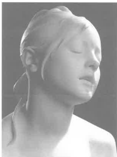
De stilte van het graf