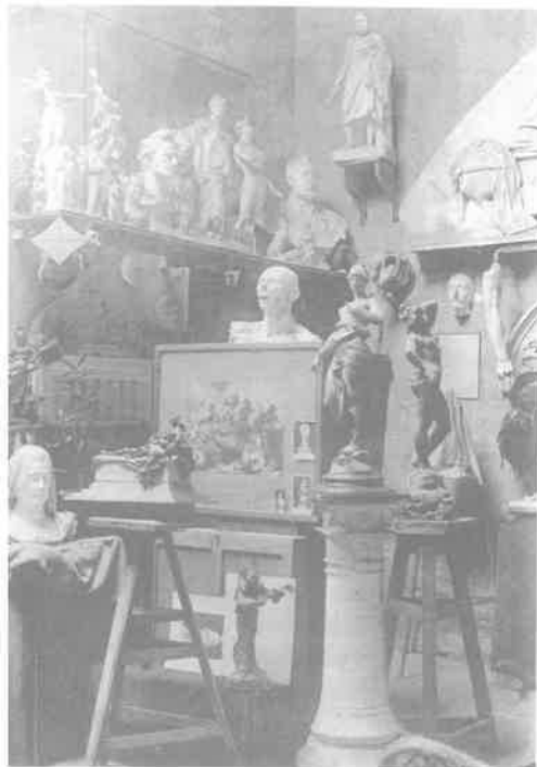
foto van het atelier van Juliaan Dillens uit: Edmond Louis De Taeye, Les artistes Belges contemporains , Brussel, 1894.

"Son atelier, loin d'être le salon dans lequel certains artistes peignent ou sculptent pour ainsi dire au jour et à l'heure, toujours tourmentés par la crainte ridicule de salir les tapis précieux ou les meubles soigneusement cirés, est, au contraire le champ de bataille sur lequel il lutte pour la gloire et le triomphe de ses esthétiques, le champ aimée don't chaque objet, depuis les frontons de l'hospice des trois-Alices, j'usqu'aux informes ébauches dormant dans la poussière des coins perdus, lui rappelle une idée, un projet, une victoire ou une défaite. Toutes les étapes de la carrière du maître se devinent dans cet encombrement qui résume ainsi sa vie artistique toute entière (...) tout cela, véritable livre ouvert". Edmond Louis DE TAEYE, Les artistes Belges contemporains , Brussel, 1894, p. 100.