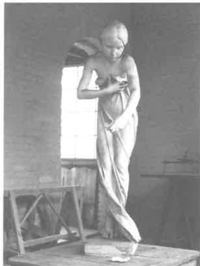
De Doodsgenius – gipsen model Voormalige ateliers Salu – verzameling Epitaf