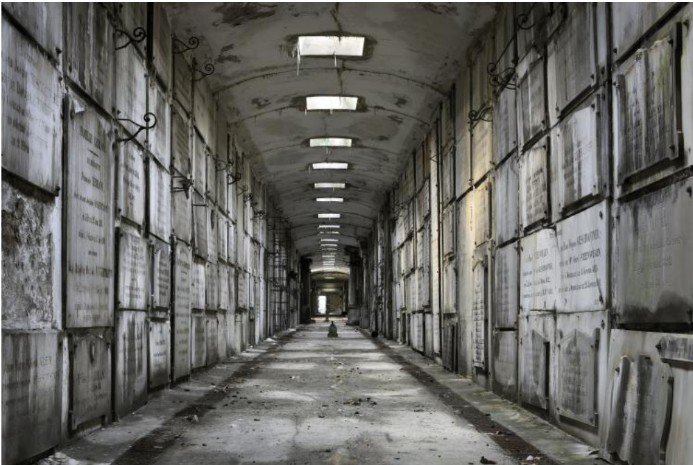
Zicht op één van de gangen van de graf galerijen van Laken

3 april 2011, 14.00.u, afspraak in het Museum voor Grafkunst gratis ledenactiviteit